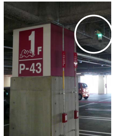
【写真上】空車時 【写真左】満車時