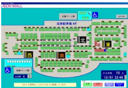
パソコン管理画面(利用状況の把握と、リモート解除)