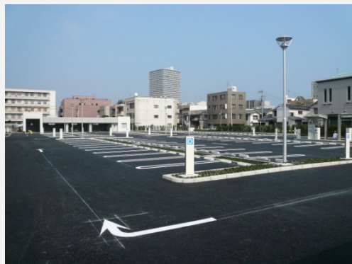
【広島高等裁判所 岡山支部 駐車場】